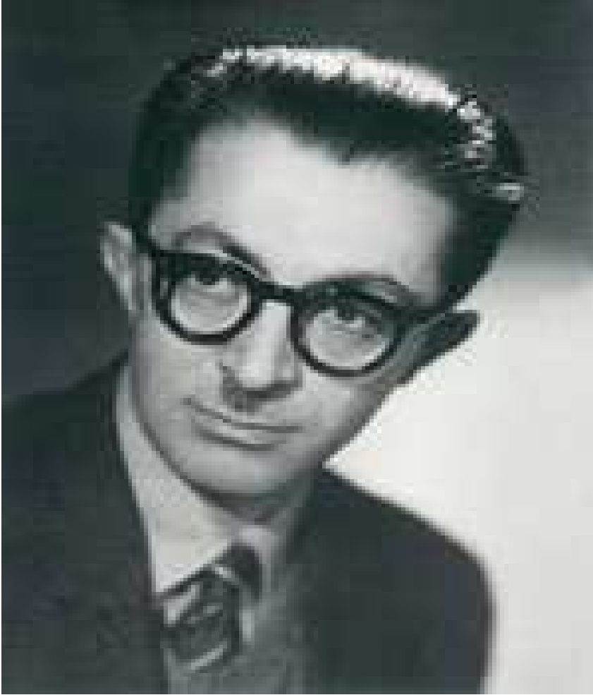
سادی هیدایهت 1951-1902