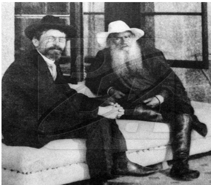
لهگه ل لیو تولستوی (۱۹۰۱)