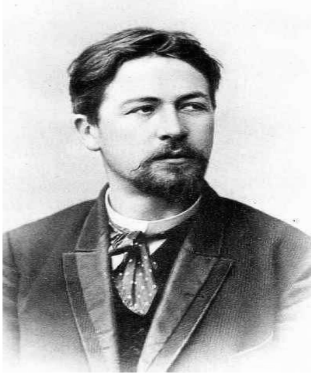
ئەنتون پافلوۋىچ چىخوف ۱۸۹۳