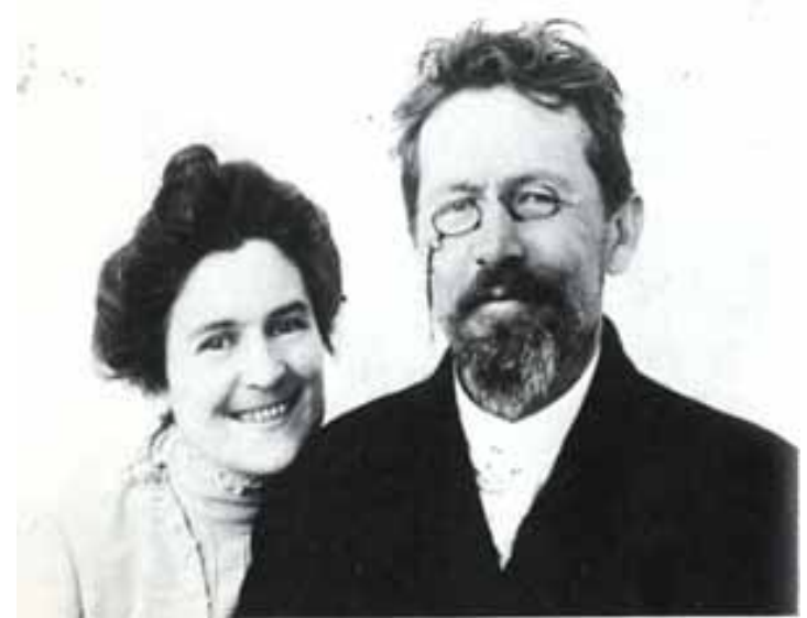
له گه ل ئولگا کنيپهري هاوسهري