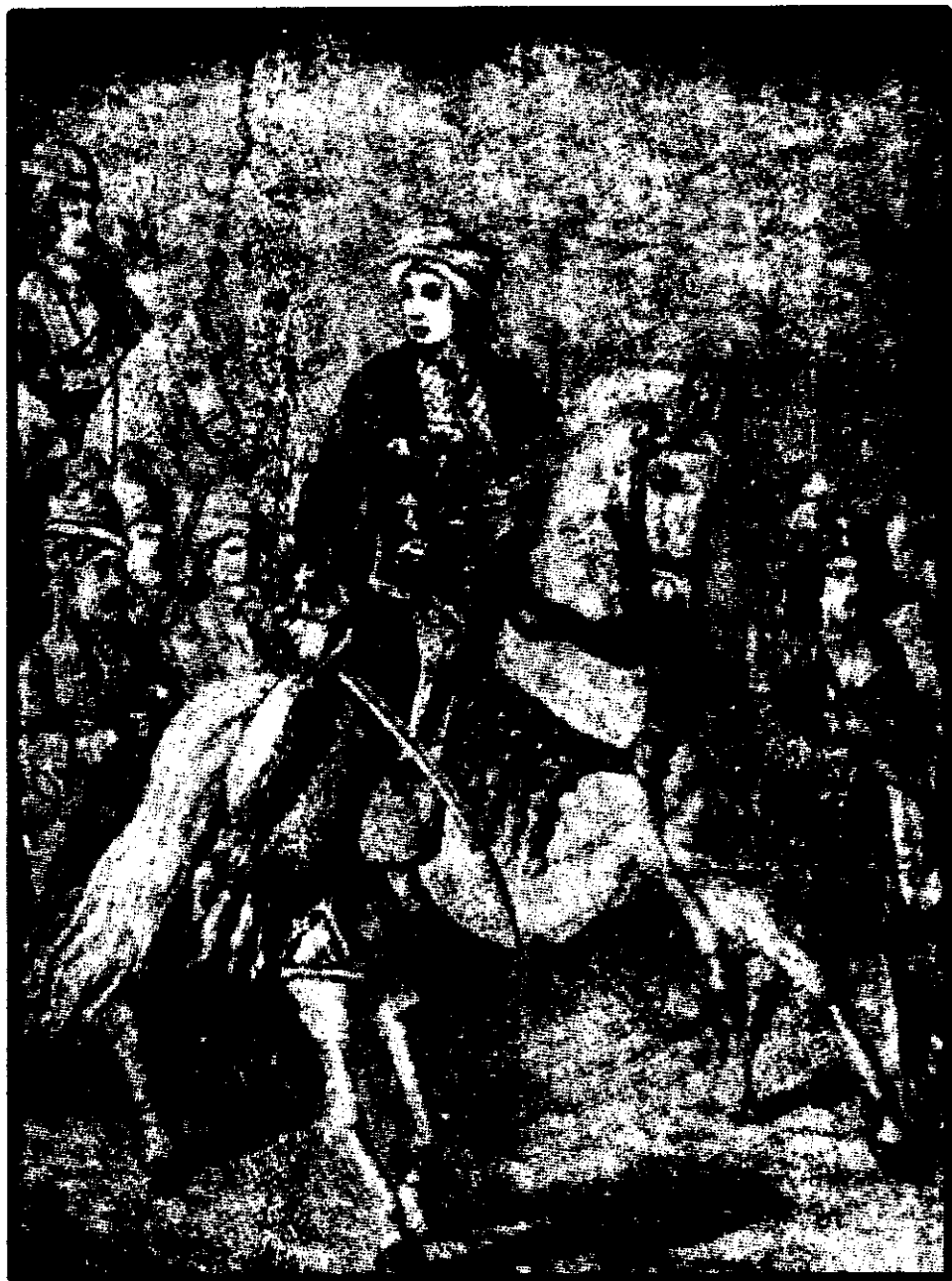
دوخت - دوت ( کیزه کوردی قوچانی )