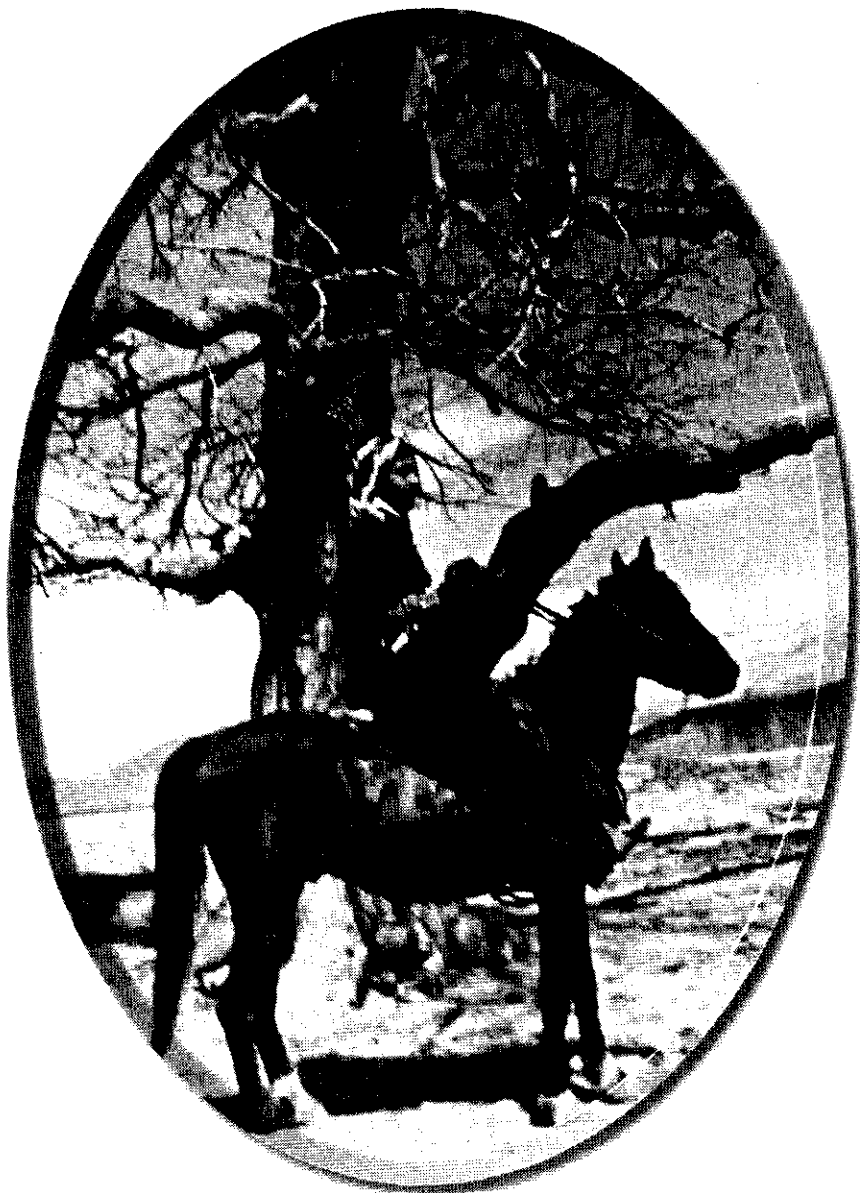
عه زيزم كورد سوار يكه ، له كاتي هه لمه ت و جه نگا هه لو ، شمقار ، دزه جوچك ، له بن چه نگا