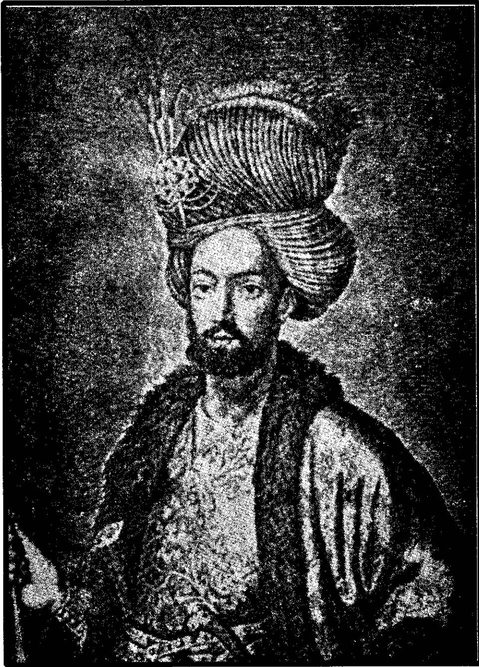
اولاد صفوی (سلطان - توماب)