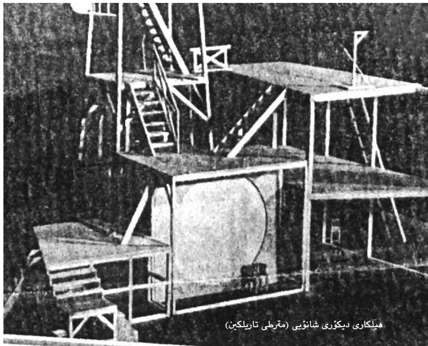
میلکاری دیکوری شانویی (مقطعی تاریکین)

ده بوايه هه نديك له ئه كتره ره كاني نمايشي "استعراضى" SHOW يان بكرديه، به وه ش ده بوايه له ئه داي شانويي دا هيژيكي جه سته يي توكمه يان وه ر بگرتايه، بويه ليتش برياري دا له گه لياندا له سه ر ميتودي بايوميكانيك ده سته كار بي ت. كاتيكي ش ده ستي به مه شق كردن كرد،