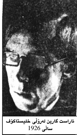
ناراست گارین له رۆلی خلیستا کوف سالی 1926

تایبەتی ئەویان دیاری کردو، بەهۆیەو له ولاتانی دیکەیشدا ناسرا. ماریـــــــــالی له کتێبه که ییدا "ئـــــــــه زمونی بیسکاتۆر"، وهك هاورپیهکی بریخت و دژیکى سیسته می هه مه گیری باس له بیسکاتۆر دهکات، ئەو له فیکرو