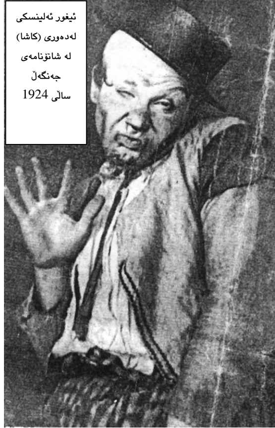
ئىغور ئەلىنسى لە دەۋرى (كاشا) لە شانۇنامەى جەنگەل سالى 1924

جۆرە ماير ھۆلڈ بوۋىيە پېشەنگى شانۇى (ھېماكارى) - رمىزى) كە لەسەرەتاي سەدەى بېستەمدا بوۋە بەشېك لەكىانى شانۇى روسى. لەو بارەيەوۋە شاعىرى ھېماكارى روسى "ئەلىكسى رېمىزوف" دەرهئىئانى ماير ھۆلڈى بۇ شانۇىيى "بەفر" ى "نوسەرى پۇلۇنى" "ستانسلاف برزۇ بۇسنرىفسكى" ى بەسەمفۇنىاي "بەفرۇ زستان" ناو برىد. لەم كاتەدا مەودايەكى بەرفراوان كەوتە نىوان ماير ھۆلڈو شانۇى ھونەرىيى مۇسكۇ كە (ستانسلافسكى و دانئشېنكۇ) پېشەوايەتېيان دەكرد، ئەو دەمەش (چىخۇف) لەرووى پۇجىيەوۋە پېشگىرىيى لە ماير ھۆلڈ دەكرد، بەجۇرىك كە (چىخۇف) شانۇىيە نۇيگەى "باخى گىلاس" ى نارد بۇ ھەرىكە لەستانسلافسكى و ماير ھۆلڈىش لەھەمان كاتدا. كاتېكىش شالۇوى مۇسكۇ كە دەقەكەى چىخۇفیان نامىش كىرد، ماير ھۆلڈ زۇر بەدەرھىئانى ئەو شانۇىيە قەلس بوو، لەو بارەيەوۋە دەنوسىت بۇ چىخۇف: "شانۇىيەكەت وەك سەمفۇنىايەكى تشايكۇفسكى ئەبېستراكتە، لەسەروو ھەمووشىانەوۋە دەبوايە دەرھىئەر گۇيى لەدەنگى ئەو سەمفۇنىايە بايە" لەو ماوۋەيەدا ماير ھۆلڈ سەردانى ئىتالىاي كىردو ئەوۋەش بەيەكەمىن گەشتى دادەنرېت بۇ دەروەى روسىا. لەوئىندەرىش چەند ئىشېكى "توماس سالفىنى" گەورە ئەكتەرى ئىتالى بىنى كە ستانسلافسكى زۇرى بەلاوۋە پەسەند بوو.