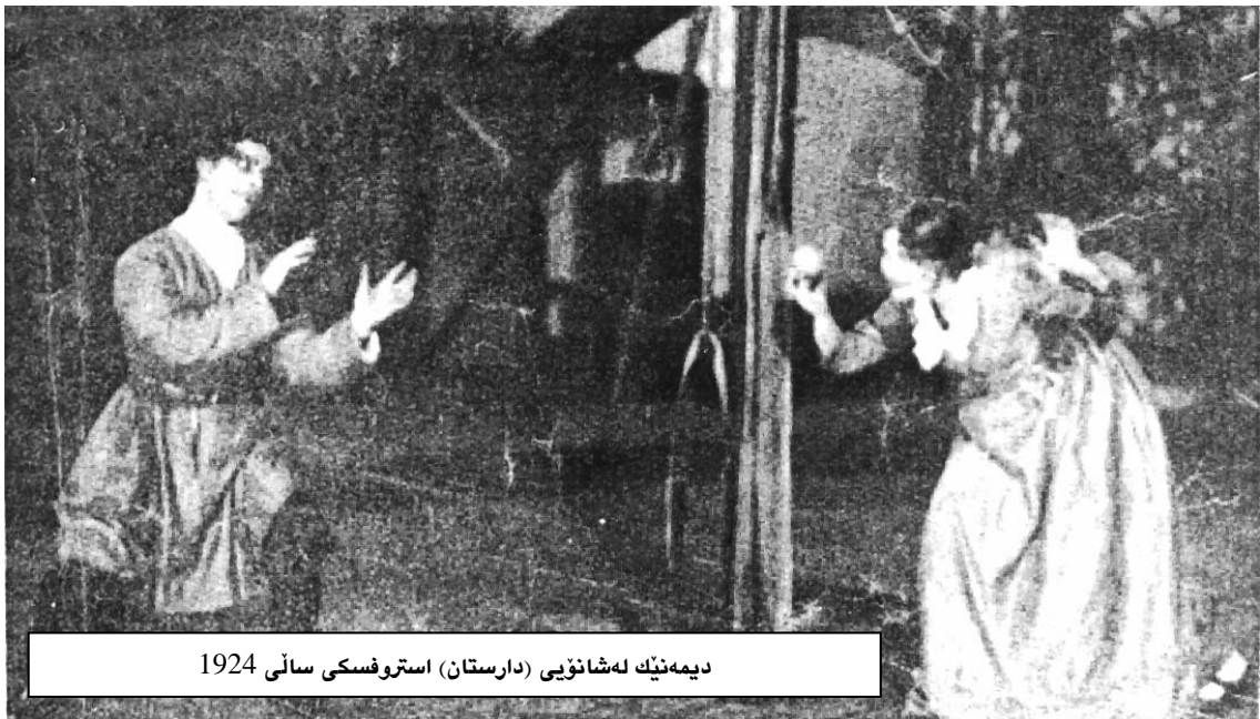
دیمەنیك لەشانۆی (دارستان) استروفسکی سالی 1924

دواتر مایر ھۆلد لەشانۆی ئەزمونگەریدا پۆچوو و لەماوەي ئیش کردنیدا لەشانۆی "کمیسا جیفسکی" دا توانی شانۆی ھێماکاری دابمەزینی... ئەو دەمەي کە لەگەل کچە ئەکتەری ناودار "کمیسا جیفسکایا" دا ئیشی دەکرد. دیارە