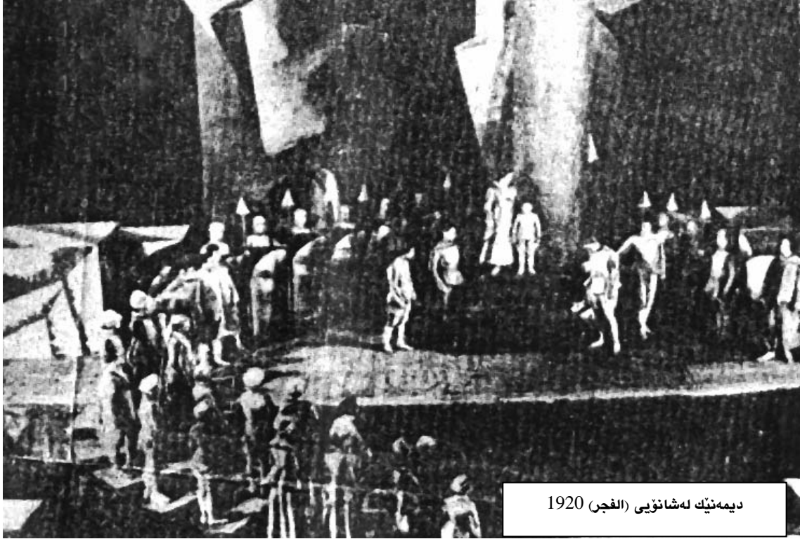
دیمه نیک له شانۆیی (الفجر) 1920

کارکردن له سهر شانۆیی "دکتور دابرتوتو" زور دژوار بوو ماوه یه کی زوری ئیش کردنی دهخواست له لایهن نوسهرو دهرهینهرو ئه کتهره کانو ته کنیکی به کانو موسیقی به کانو هه موو ئه وانهی له شانۆی شه هره زادا ئیشیان ده کرد. ئه مه جگه له وهی ئیش کردن له سهر ئه و شانۆییه دیراسه کردنی هه موو قوناغه کانی گه شه سهندنی شانۆی مایر هۆلډو میتۆدی شانۆیی ئه وی ده ویست، هه ر له هیماکارییه وه تا بۆنیا دگه ری و به دوا داچوونی مایر هۆلډ له سه رده می خۆیدا و ئه وانهی ئیشیان له گه لدا کردوه له دۆست و نه یارانێ.