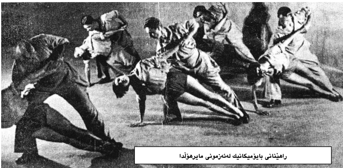
راھىئانى بايۇمىكانىك لەئەزمونى ماير ھۆلد

لەسالى 1918دا ۋەبۇنەى ئاھەنگەكانى يادى شۆپشە ۋە ھەلسا بەدەرھىئانى شانۆيىيە "مستىريا بۇف" بە ۋەش ماير ھۆلد بەيەكەمىن دەرھىئەنەر دادەنرېت كە يەكەمىن شانۆيىيە روسى دەرھىئانىيەت، لەسەردەمى شۆپشەدا نوسرا بېت. شانۆيىيەكە لە ھەلومەرجىكى ناھەمواردا بەرھەم