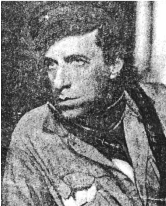
ماير هۆلڊ سالى 1922

دەرھینەری ناوداری ئەمریکی و ئەوروپی، ئەوانەى كه به تايبه تی و به مه به سستی ناسینی نمایشه كانی ستانسلافیسكى و ماير هۆلڊو دەرھینەرانى دى