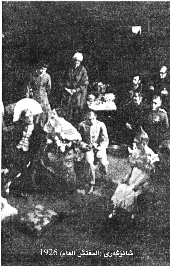
شانۇگەرى (المفتش العام) 1926

لەئىشەكانى "ليتش" دا دوو ئاراستەى ديار بەدى دەكرىت، يەكەمىان ئىش كردنە لەسەر ھونەرەكانى سىرك و كارامەيى ياريزانەكانى، لىرەدا خوئىندكار ھونەرەكانى سىرك وەردەگرىت، بەئاسان و گرنگەكانىەو، وىراى رايھىنان لەسەر جومناستىك، ھەر لەبازدانەو تا مەشقە دژوارەكان... ئەمانەيش كۆمەلە رايھىنانىكن كە لە "ئىتۇدەكانى" بايۇمىكانىكى ماير ھۆلدەو وەرگىراون.