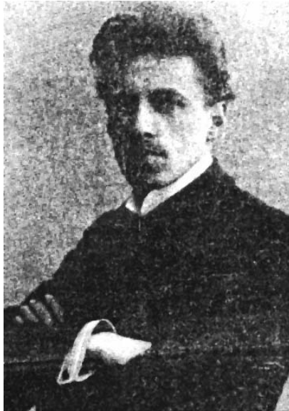
مایرهۆلد سالی 1905

هۆكاری بنه پرتی ته عبیری نواندن به پیی بۆچوونی مایرهۆلد بریتی نیه له: (میمیکا - جولاندنی رهگه ده ماره کانی ده موچاوی) به لگو بریتییه له (پلاستیک - ئاسانی جولەکان) هه ریۆیهش جولە هه رده م ژانریکی سه ره کی بووه له بایۆمیکانیدا، به و ئیعتیباره ی که بونیادگه ری سه ره تایی داهینانی نواندن له سیستمی مایرهۆلد.