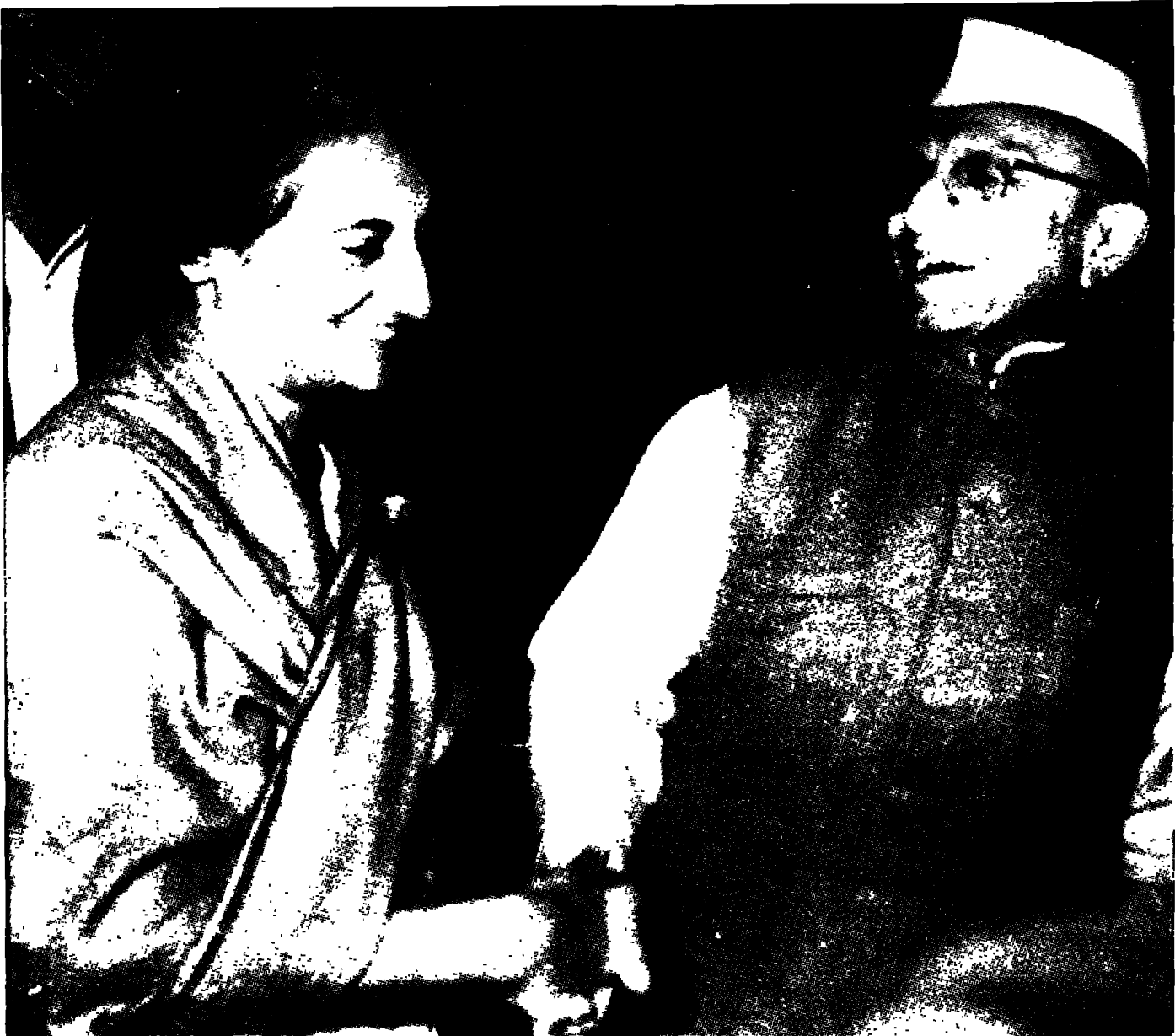
श्री मोरारजी देसाई एवं श्रीमती इंदिरा गांधी