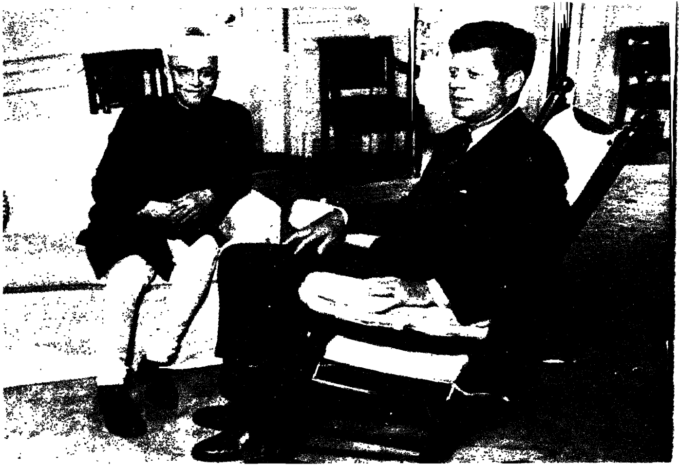
1963 में तत्कालीन वित्तमंत्री श्री मोरारजी देसाई अमेरिका के राष्ट्रपति जान केनेडी के साथ