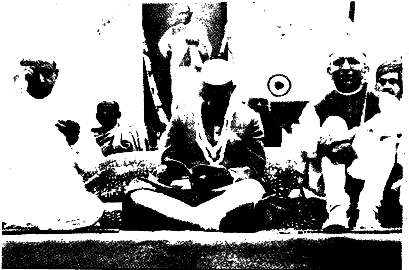
1947-52 के दौरान मुंबई के तत्कालीन मुख्यमंत्री श्री बालासाहब खेर, तत्कालीन प्रधानमंत्री पंडित जवाहरलाल नेहरू एवं मुंबई के तत्कालीन गृहमंत्री श्री मोरारजी देसाई