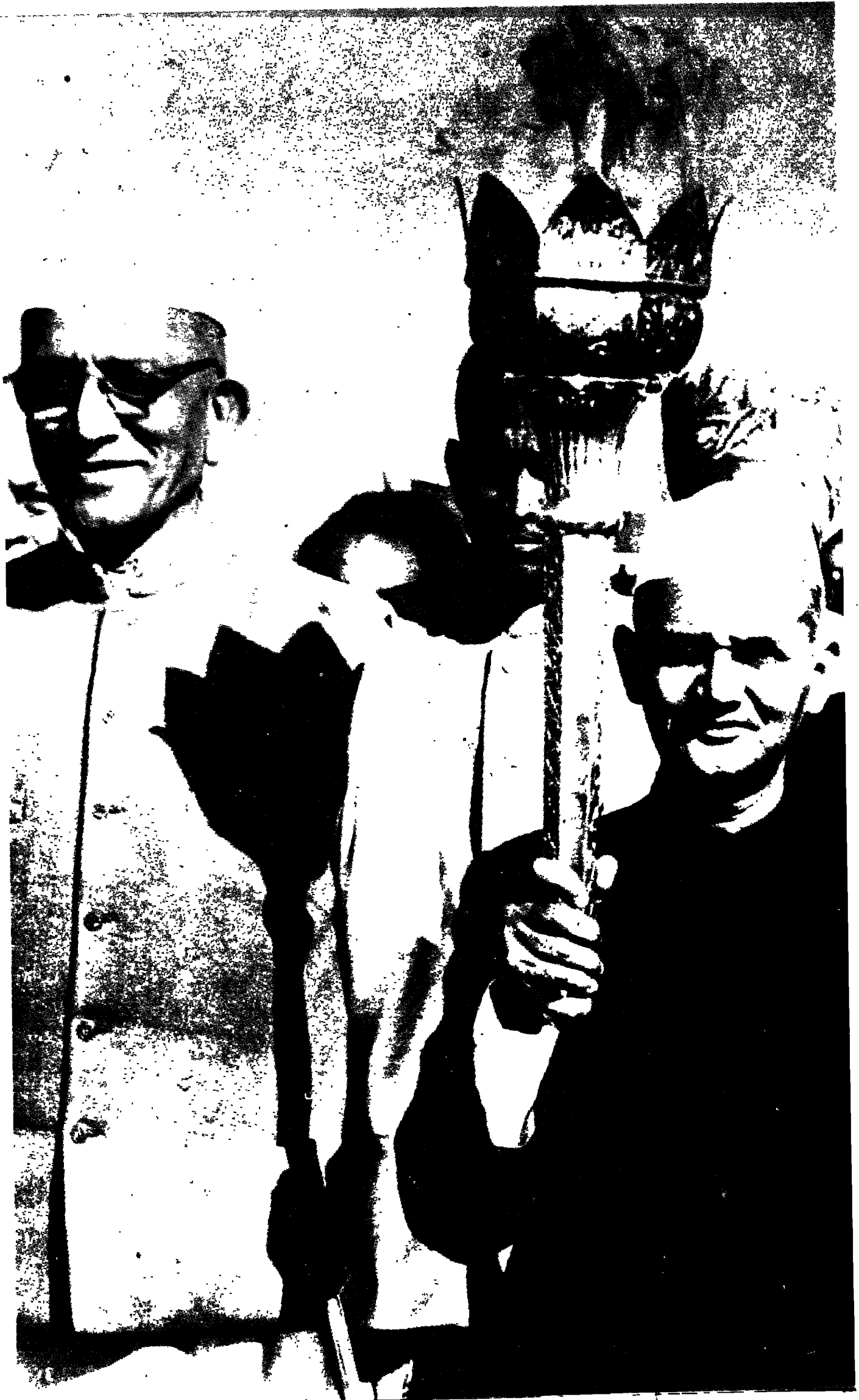
श्री मोरारजी देसाई श्री लालबहादुर शास्त्री के साथ