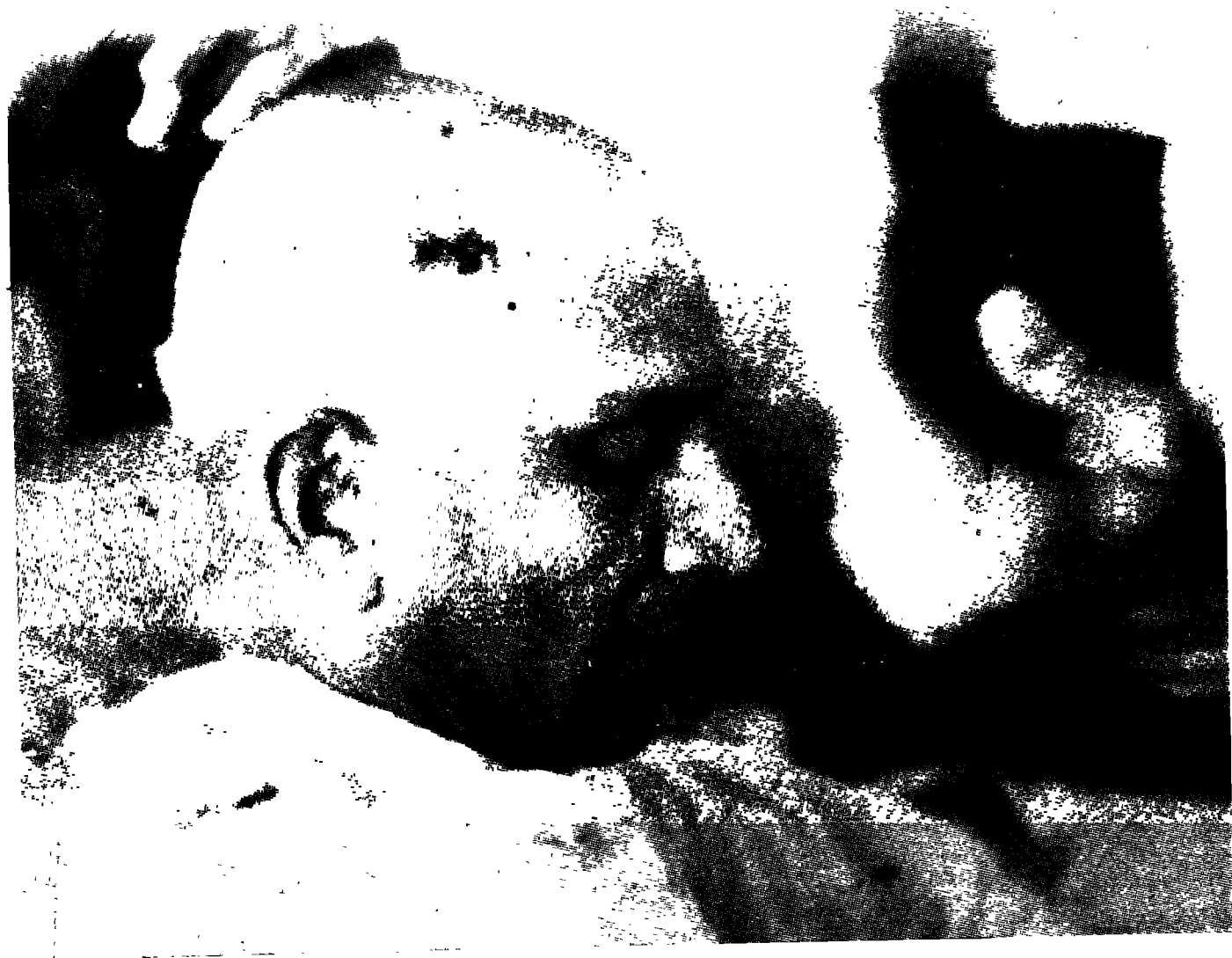
1952-53 में श्री मोरारजी देसाई की बिना एनीस्थीसिया दिये शल्य चिकित्सा की गई