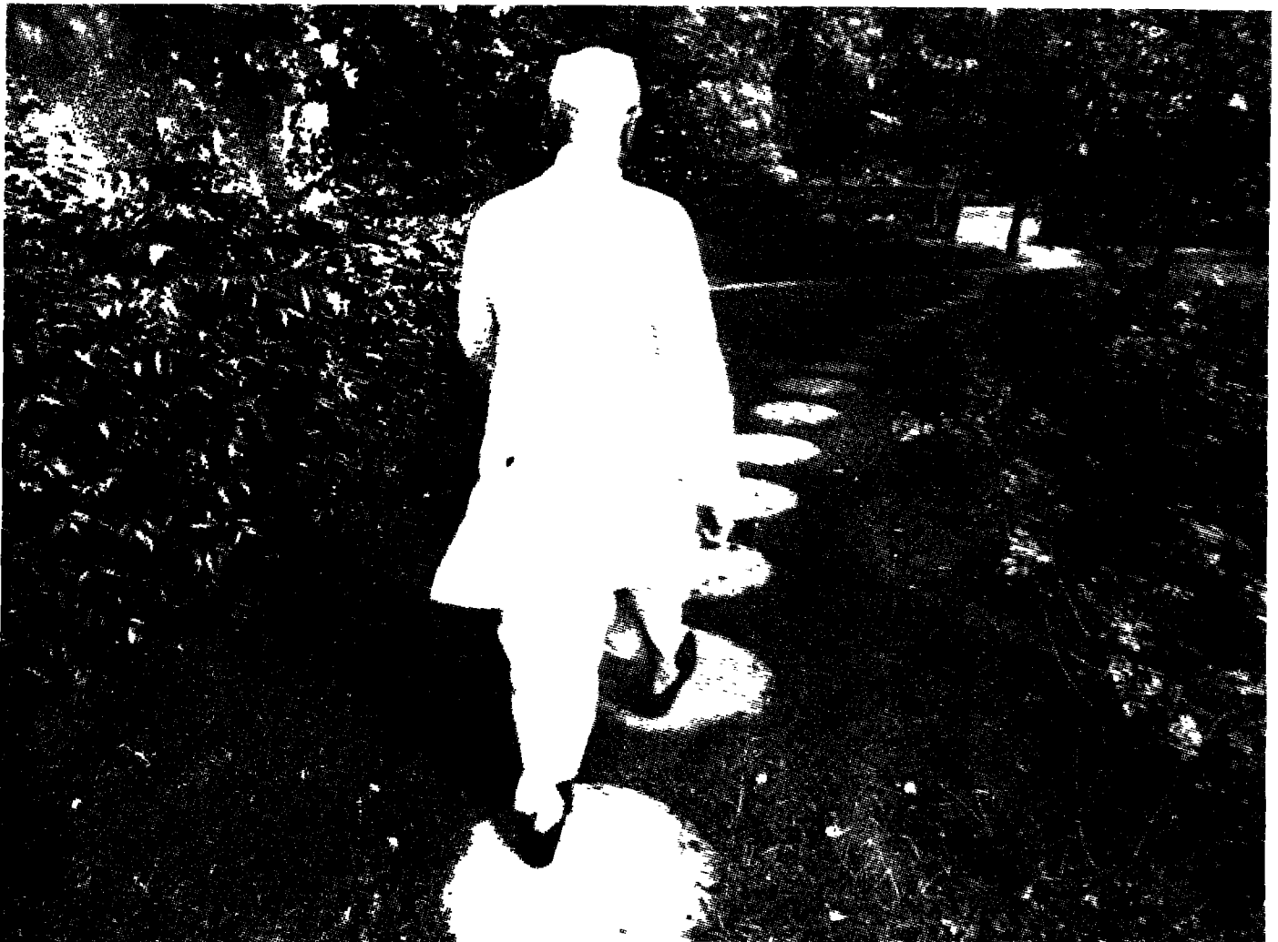
श्री मोरारजी देसाई प्रधानमंत्री के रूप में, दिल्ली में-प्रधानमंत्री निवास से प्रधानमंत्री कार्यालय की ओर जाते हुए