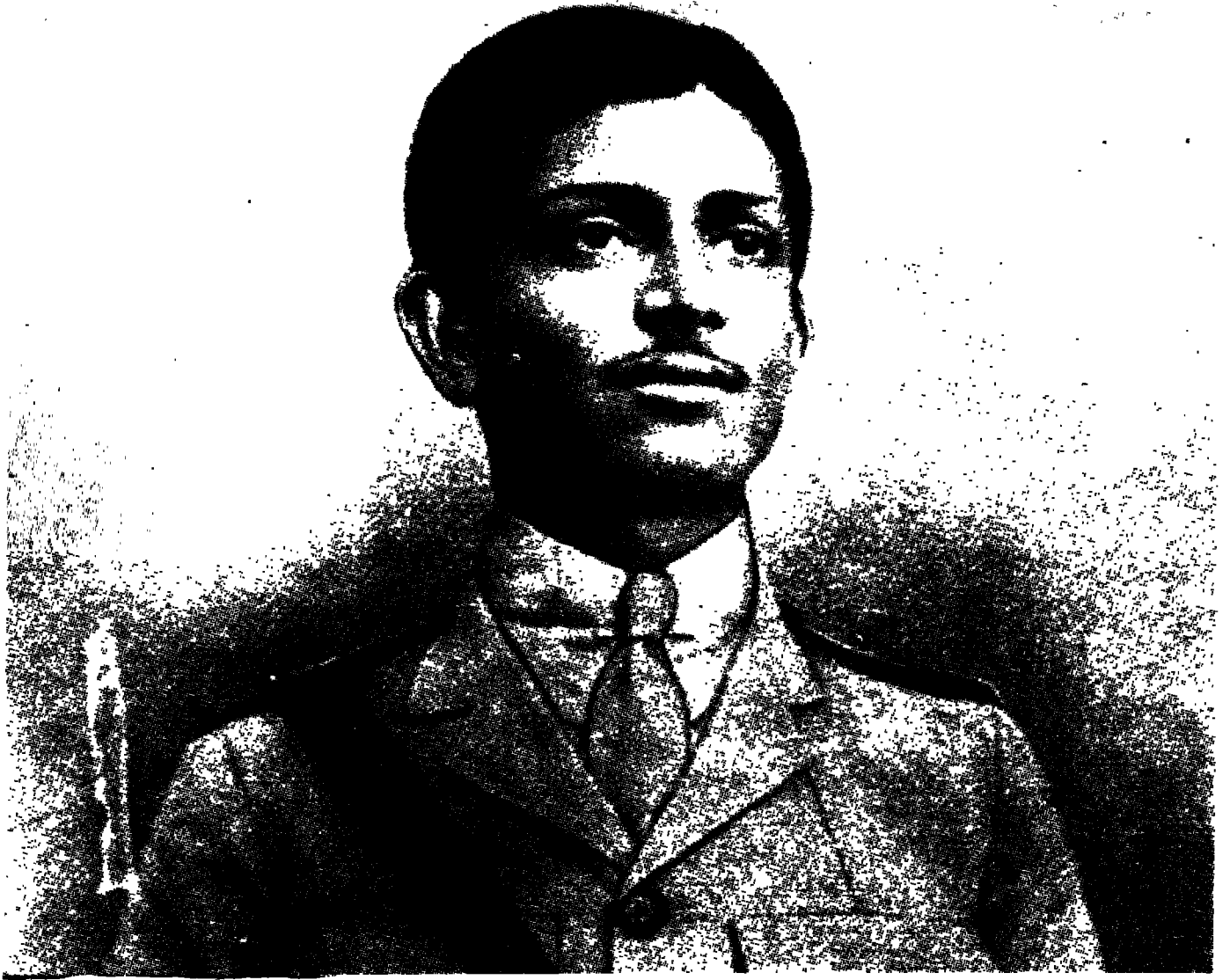
श्री मोरारजी देसाई, विश्वविद्यालय के प्रशिक्षण सत्र के दौरान अधिकारी प्रशिक्षण कोर्स में महाविद्यालयी छात्र के रूप में