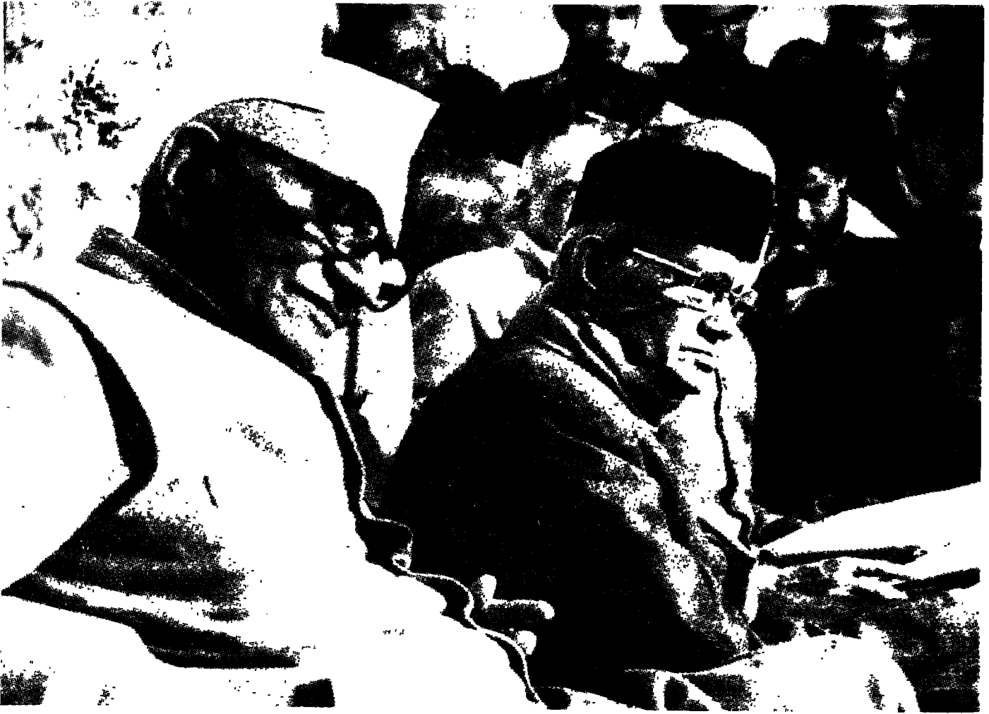
1977 में जनता पार्टी सरकार के दौरान प्रधानमंत्री चुने जाने के समय श्री मोरारजी देसाई श्री जयप्रकाश नारायण के साथ