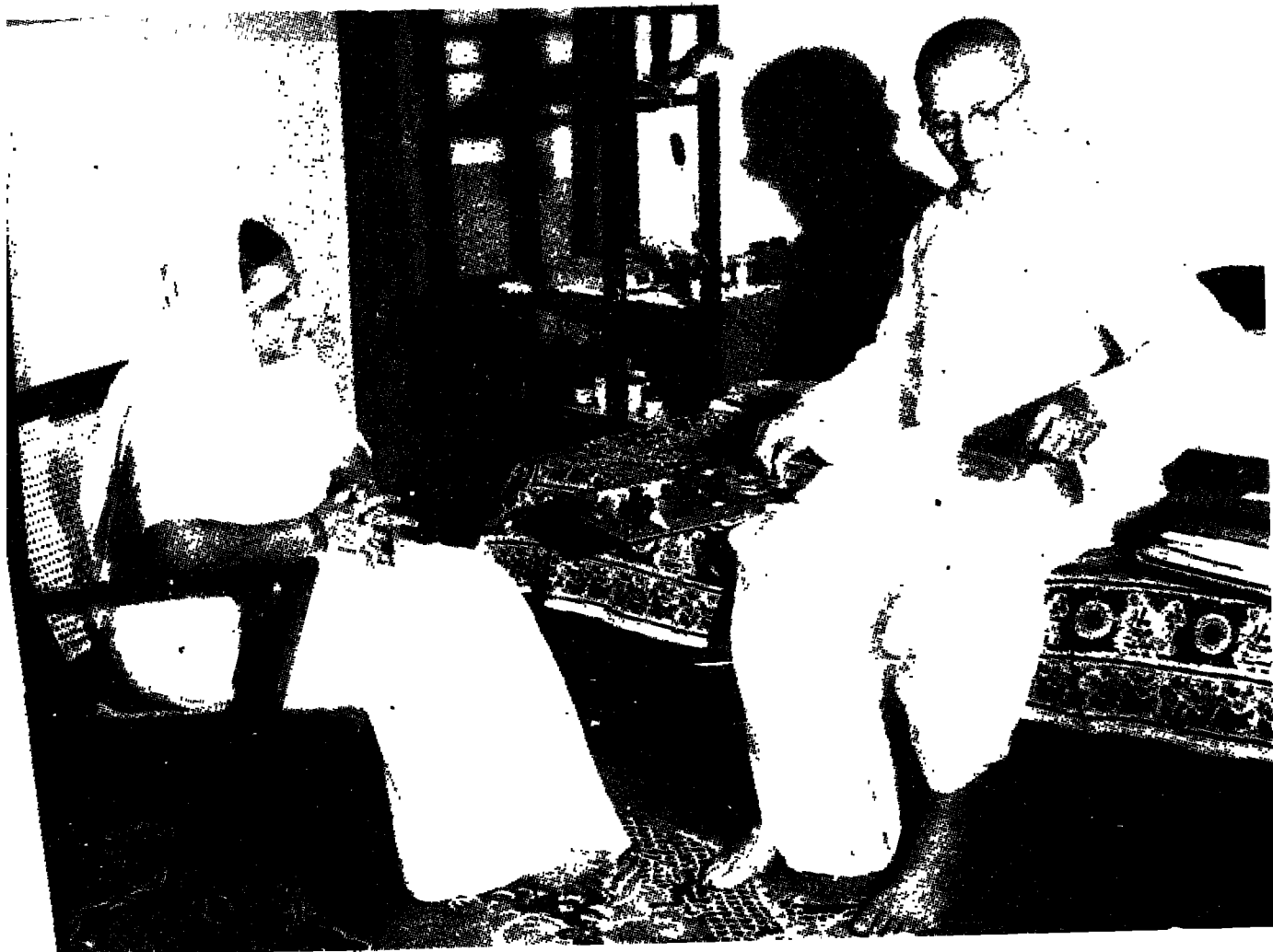
1964 में कामराज योजना के दौरान मंत्री पद से त्यागपत्र देने के बाद पत्नी के साथ, 7, त्यागराज मार्ग, दिल्ली में